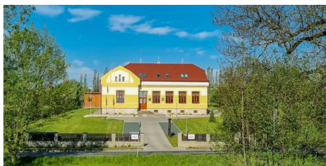
Klokočí obecní dům (okr. Přerov)

Putovní výstava Má vlast cestami proměn přináší svědectví o příznivých proměnách zanedbaných míst a sídel v naší krajině. Díky odhodlání místních lidí a ochotě řady donátorů se chátrající stavby mění v důstojné objekty s užitečnou náplní, veřejný prostor dostává novou tvář, sakrální objekty nacházejí svůj ztracený smysl a příroda se nadechuje k novému životu.