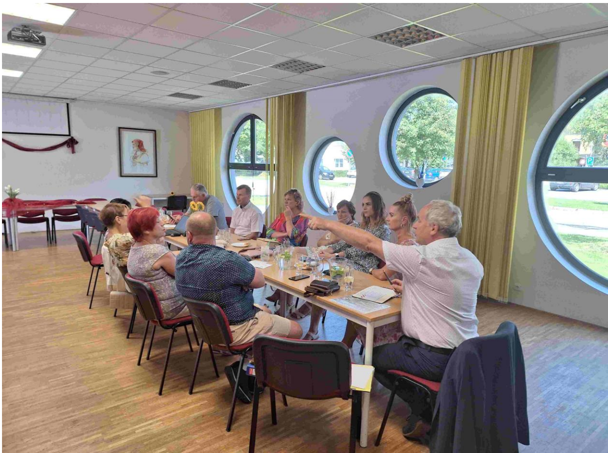
Jednání předsednictva dne 16. 8.2023 v Čechách pod Kosířem