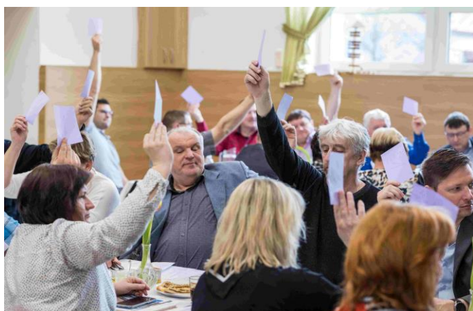
Hlasování členů SPOV OK na jednání valné hromady