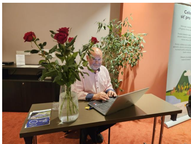
Jednání předsednictva dne 3.-4.10.2023 v Lipové-lázně