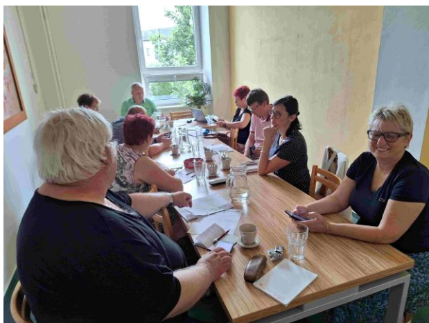
Jednání předsednictva dne 27.6.2023