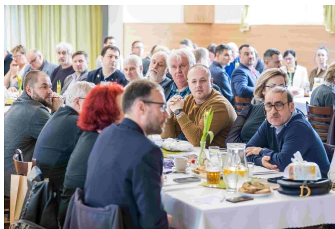
Účast členů SPOV OK na jednání valné hromady